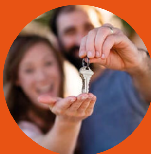
Verhuur woningen en bedrijven