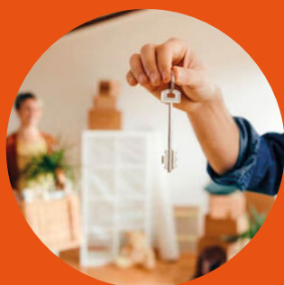
Verkoop woningen en bedrijven