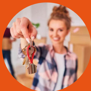
Aankoop wonen en bedrijven