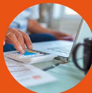
Taxaties wonen en bedrijven